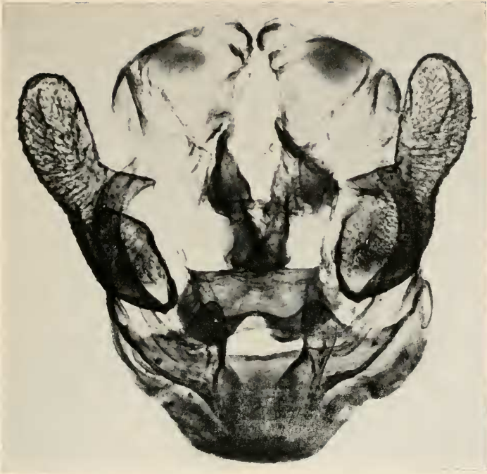
Abb. 2: Heparia anselminae n. sp. Männlicher Genitalapparat

übergestellten Doppelfigur, ähnlich dem Hals, Kopf und Schnabel eines Raubvogels. Das Vinculum ist größer. Die untere Fultura deutlich sklerotisiert. Weitere Unterschiede zeigen die Abbildungen 2 und 3.